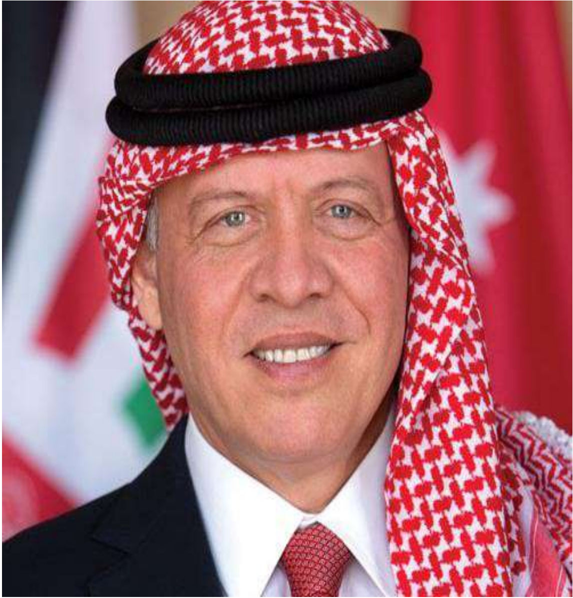
صاحب الجلالة الهاشمية الملك عبدالله الثاني بن الحسين المعظم