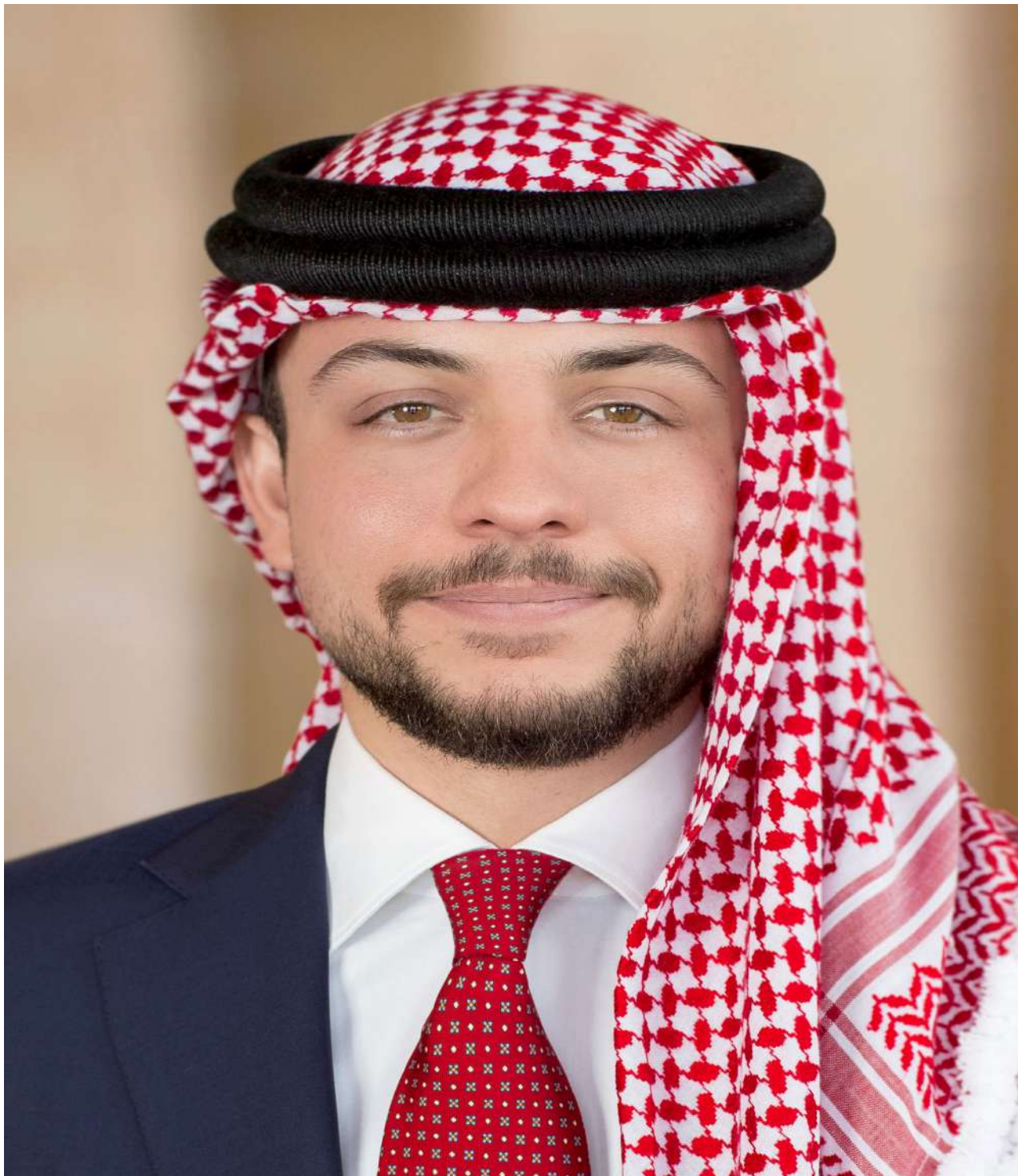
صاحب السمو الملكي ولي العهد الأمير الحسين بن عبدالله الثاني