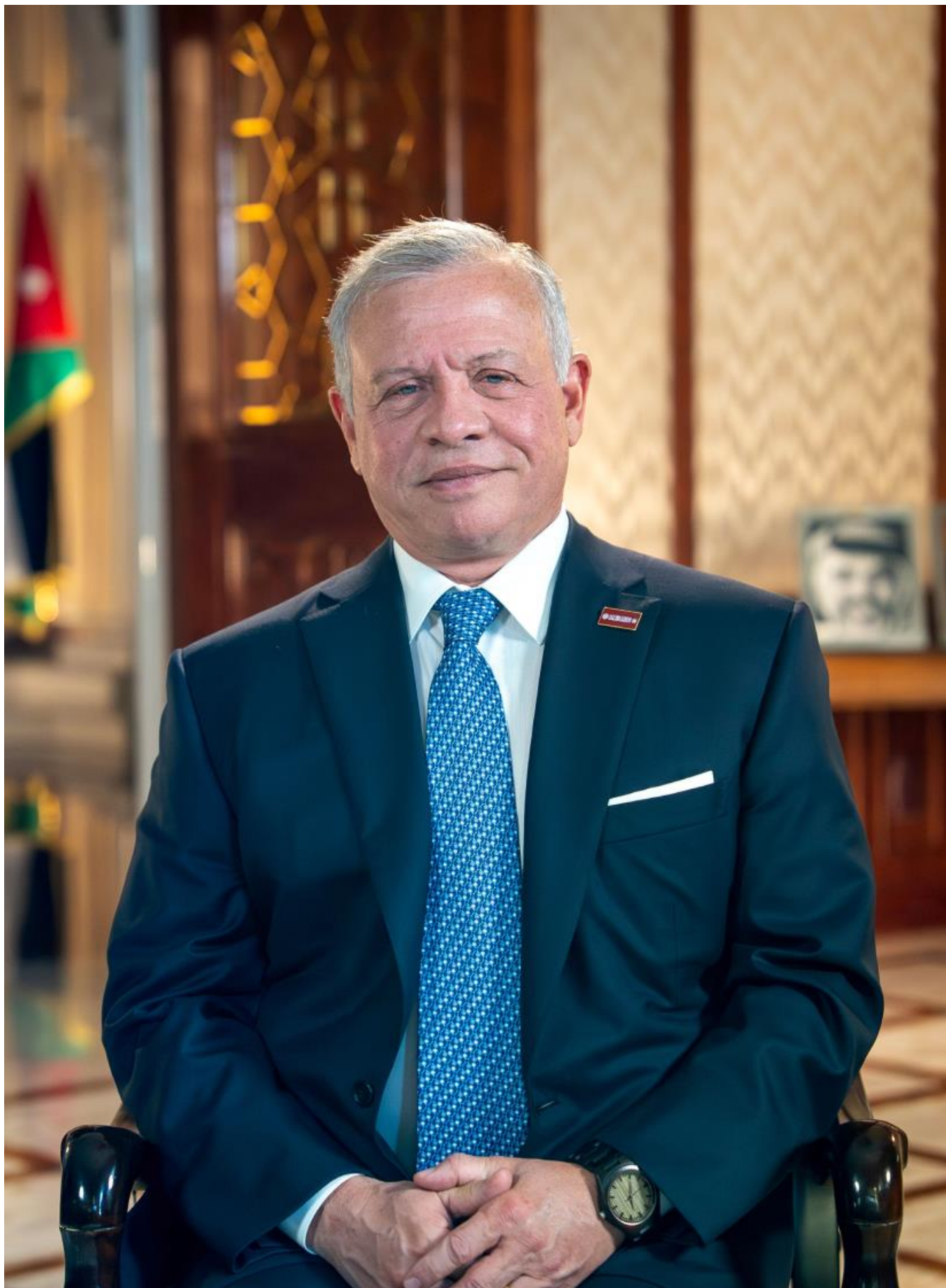
حضرة صاحب الجلالة ملك المملكة الاردنية الهاشمية عبد الله الثاني بن الحسين المعظم