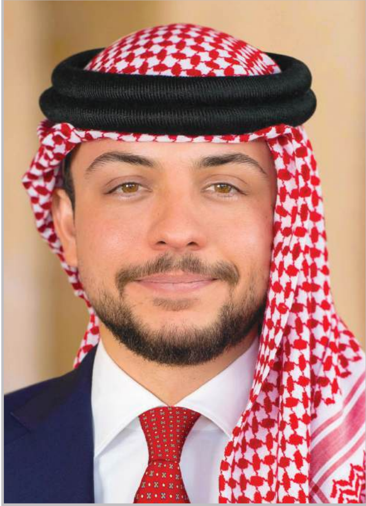
الأمير حفرة صااب السمو الملكي الحسين بن عبد الله الثاني ولي العهد المعظم