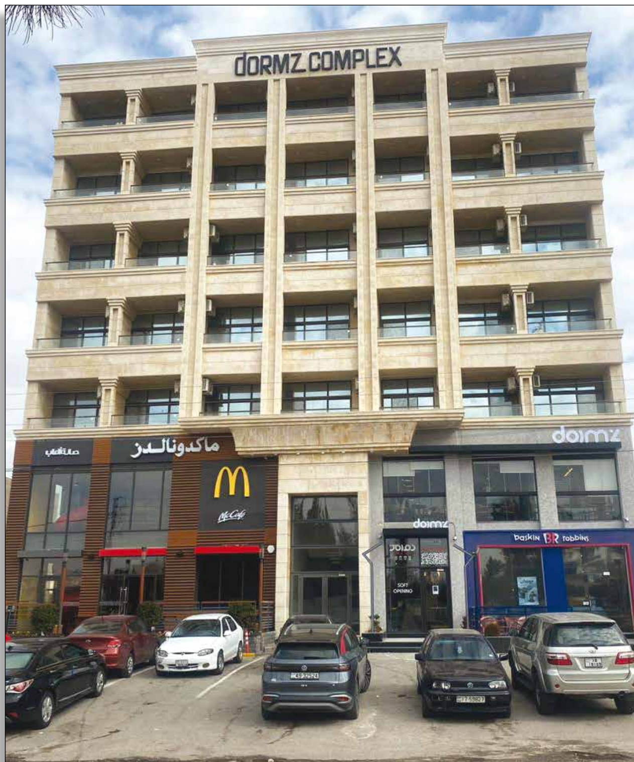
مجمع شركة هامن العقارية