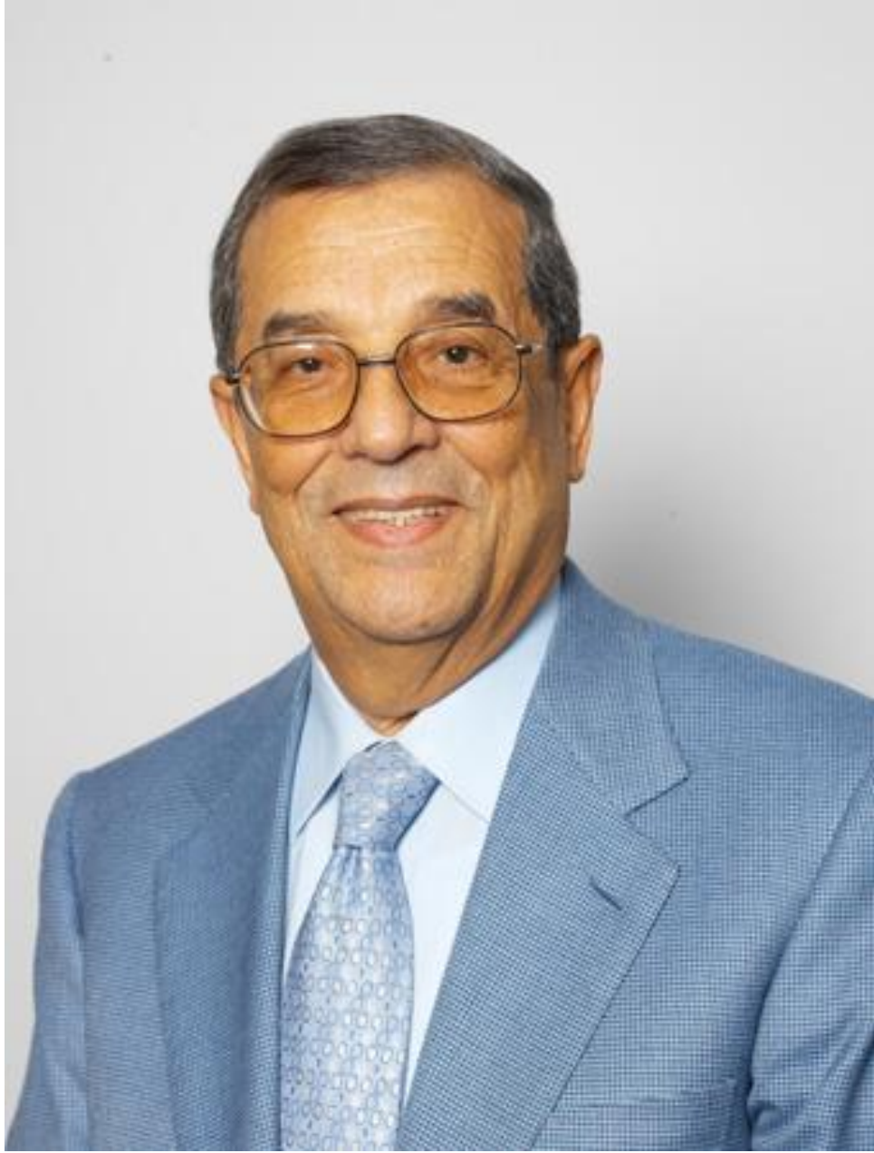
معالي المغفور له باذن الله الدكتور سميح طالب دروزه رائد الصناعة الدوائية في العالم العربي