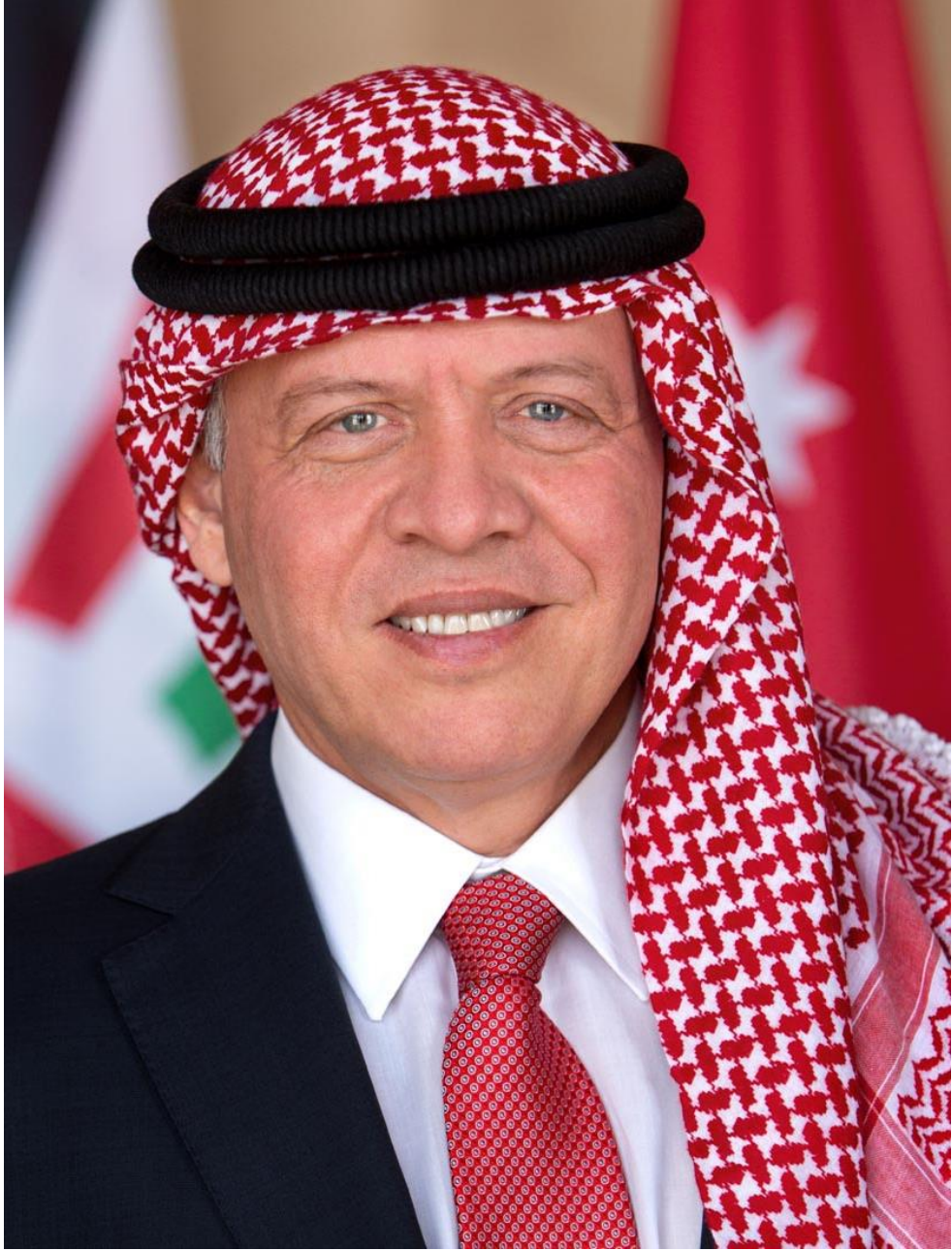
حضرة صاحب الجلالة الملك عبد الله الثاني ابن الحسين المعظم