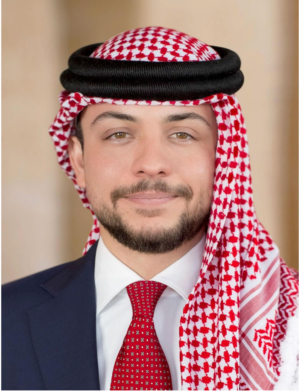
صاحب السمو الملكي الأمير الحسين بن عبد الله الثاني ولي العهد