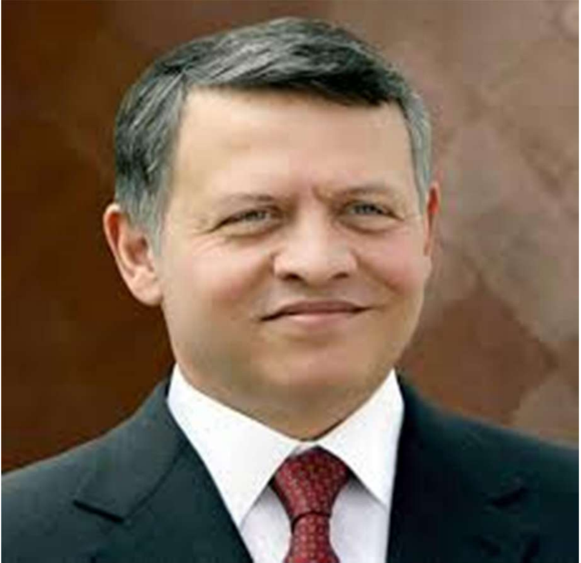
حضرة صاحب الجلالة الملك عبد الله الثاني بن الحسين المعظم