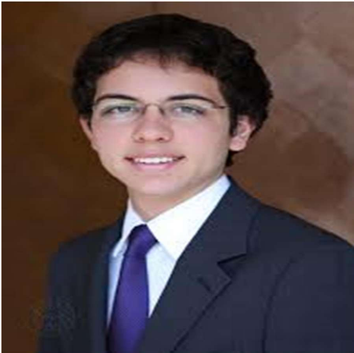
صاحب السمو الملكي الأمير الحسين بن عبد الله الثاني ولي العهد المعظم