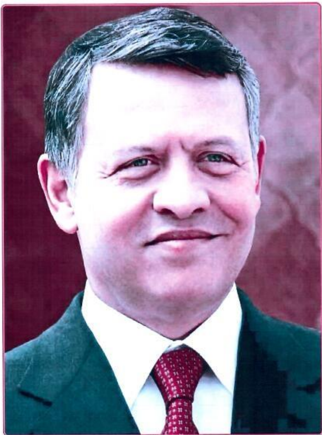
صاحب الجلالة الملك عبد الله الثاني بن الحسين المعظم