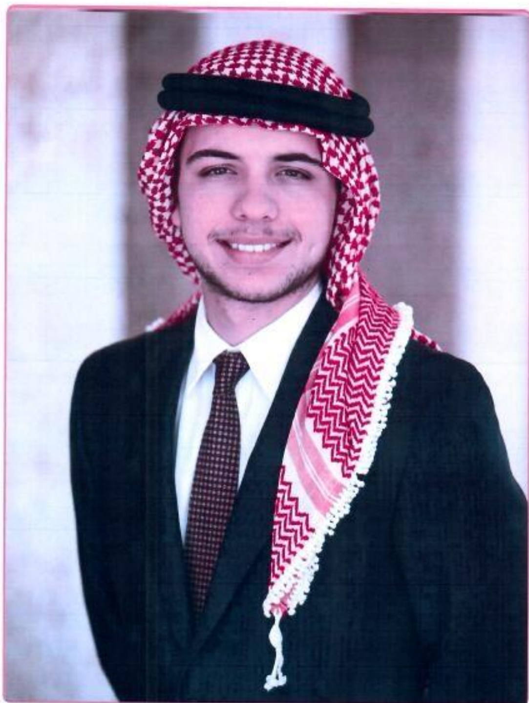
ولي العهد صاحب السمو الملكي الامير الحسين بن عبد الله الثاني بن الحسين المعظم