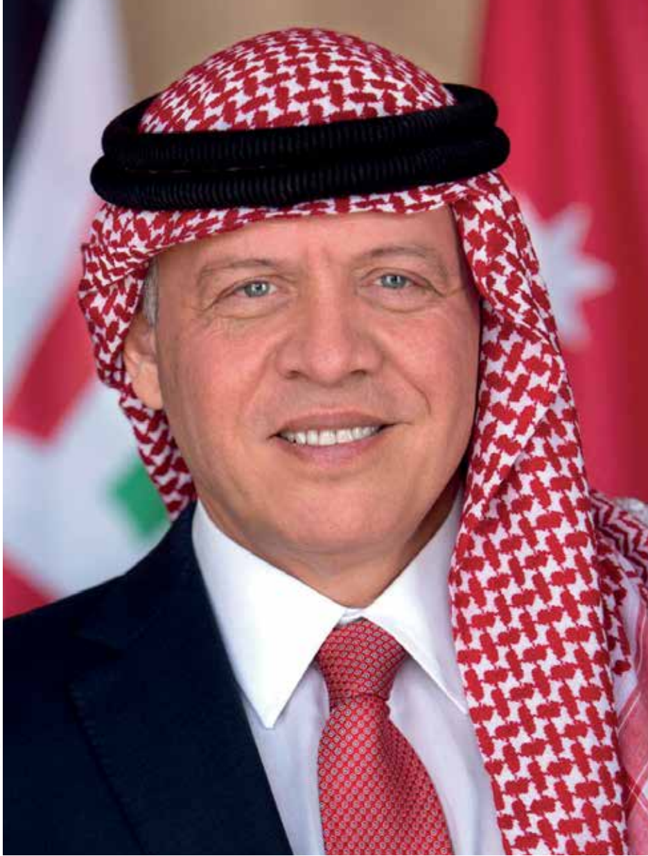
حَضْرَةُ صَاحِبِ الْجَالَةِ الْهَاشِمِيَّةِ الْمَلِكُ عَبْدُ اللَّهِ الثَّانِي، ابْنُ الْحُسَيْنِ، الْمَعْظَمِ حَفِظَهُ اللَّهُ