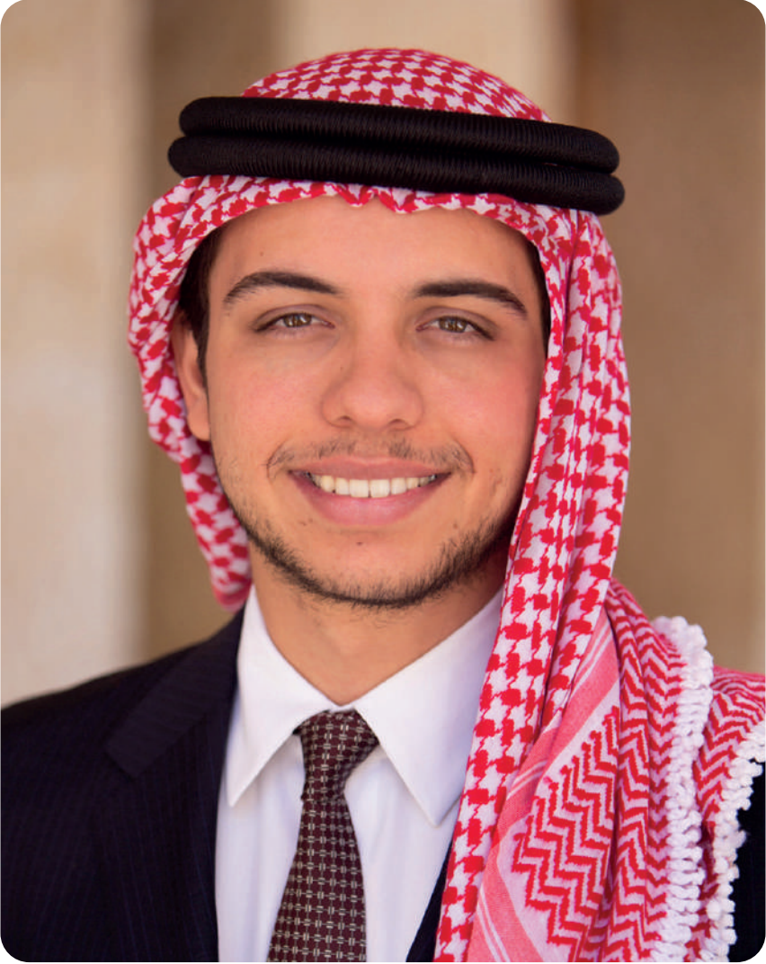
محاضرة صاحب السمو الملكي الأمير حسين بن عبد الله الثاني المعظم