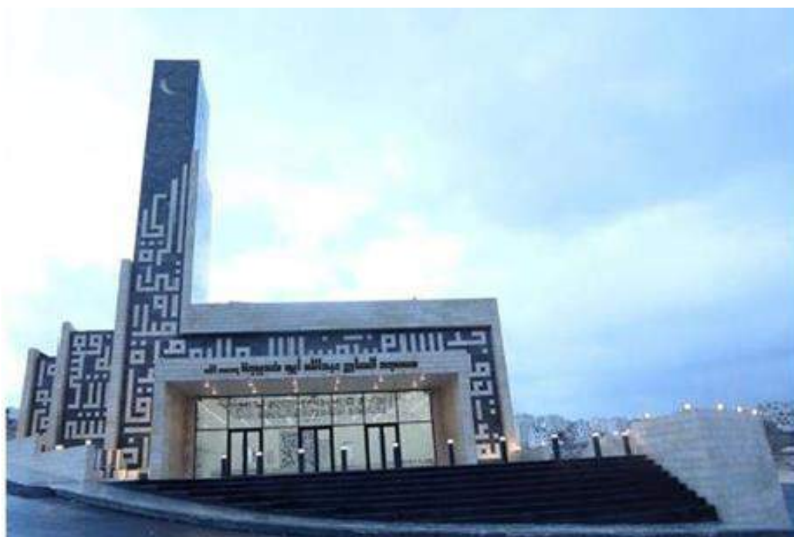
كلمة رئيس مجلس الإدارة