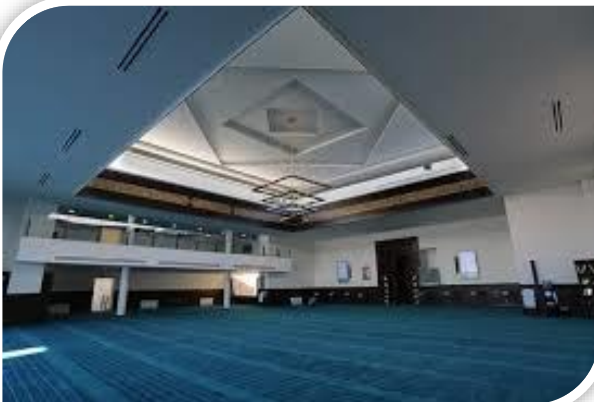
هيئة الفتوى والرقابة الشرعية