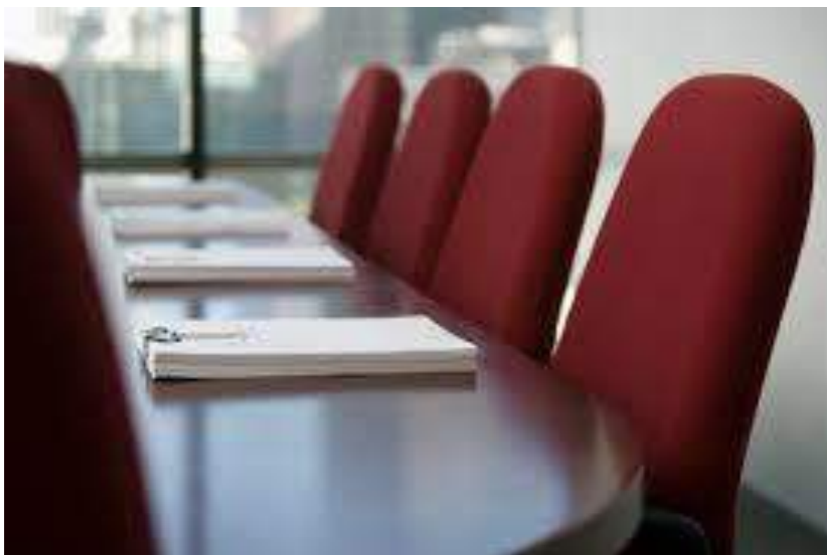
مجلس ادارة الشركة