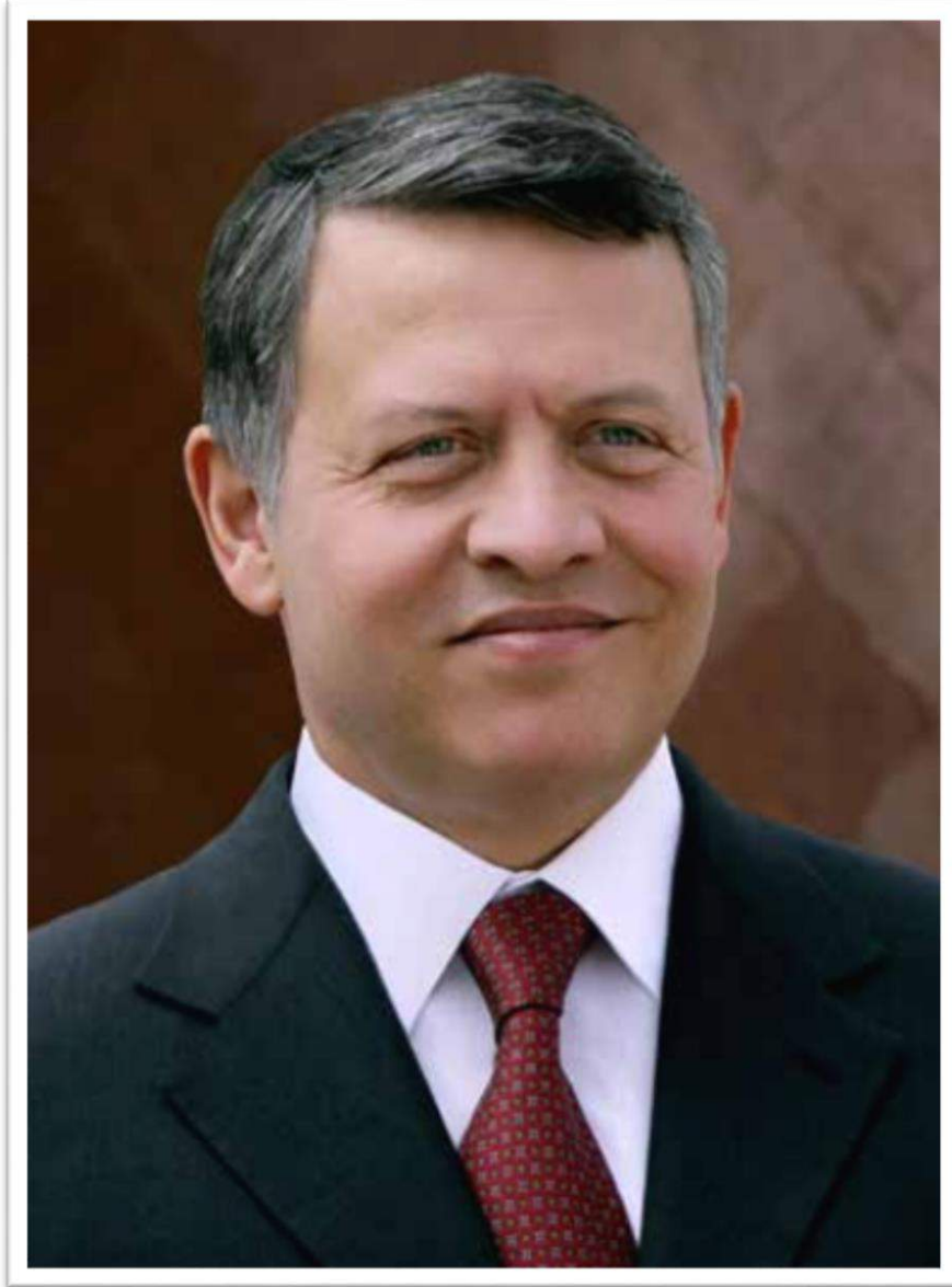
حضرة صاحب الجلالة الملك عبدالله الثاني بن الحسين المعظم