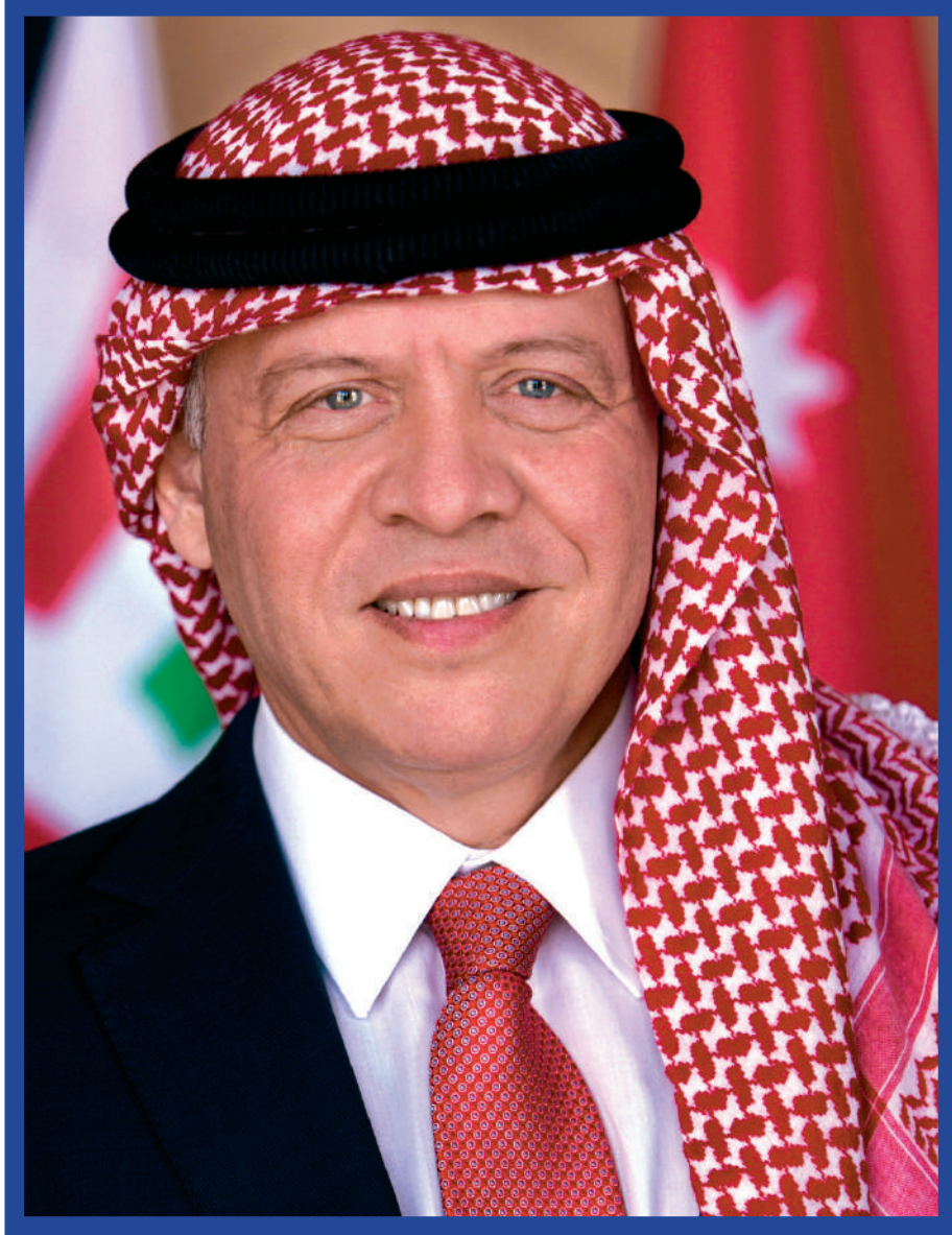
حضرة صاحب الجلالة الهاشمية الملك عبدالله الثاني ابن الحسين المعظم