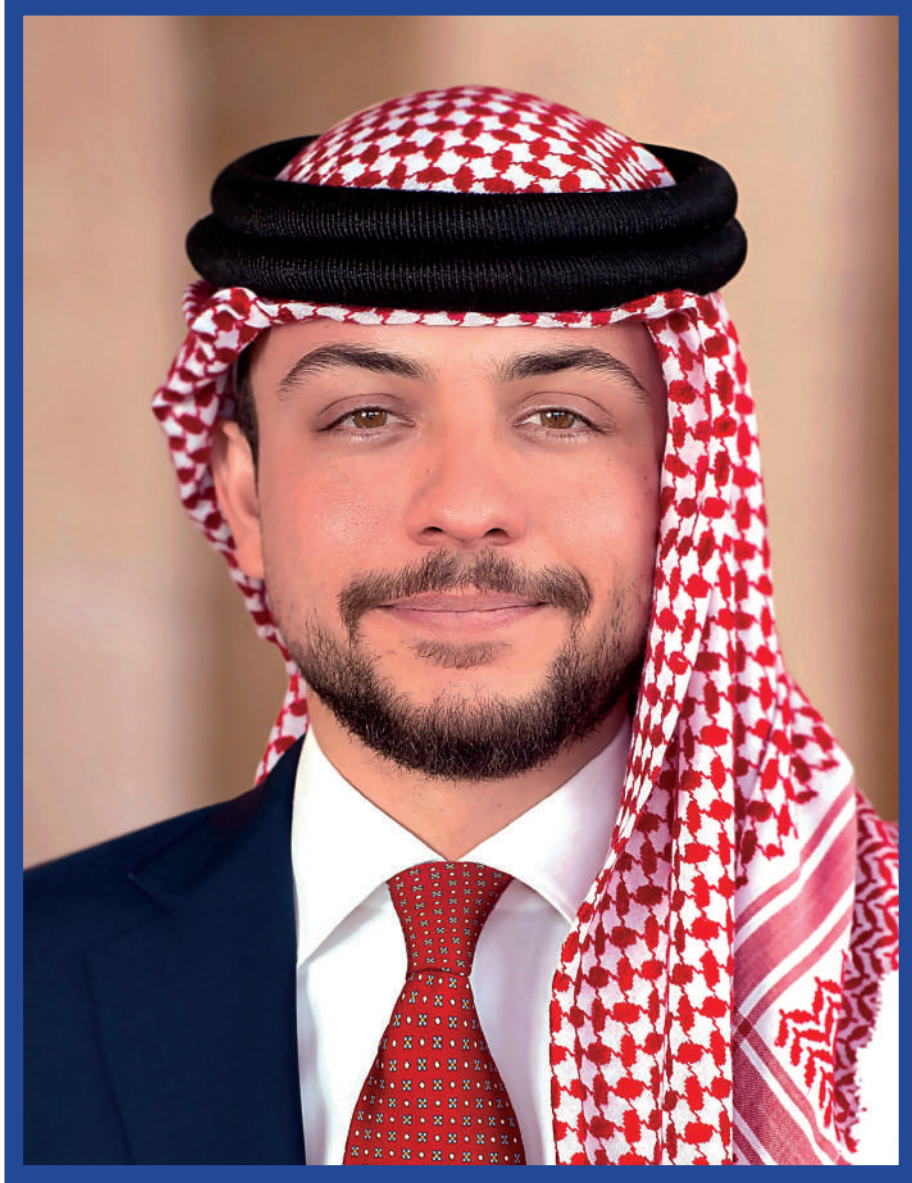
حضرة صاحب السمو الملكي الأمير الحسين بن عبدالله الثاني ولي العهد المعظم