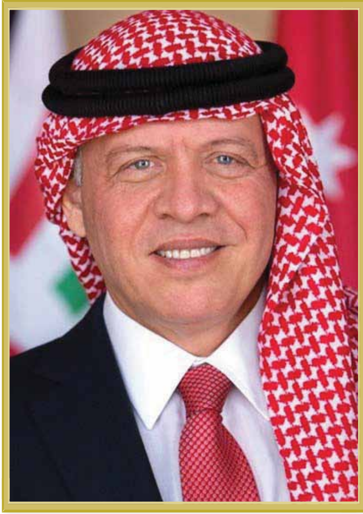
حضرة صاحب الجلالة الملك عبدالله الثاني ابن الحسين المعظم