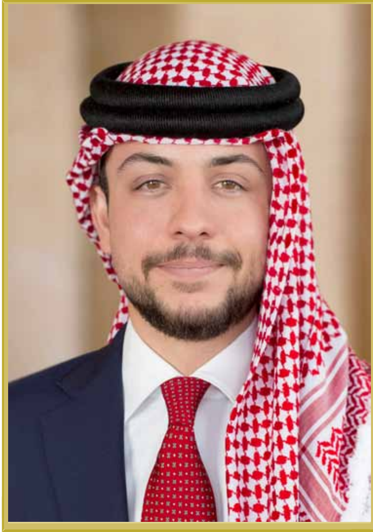
ولي العهد الأمير حسين ابن عبدالله الثاني