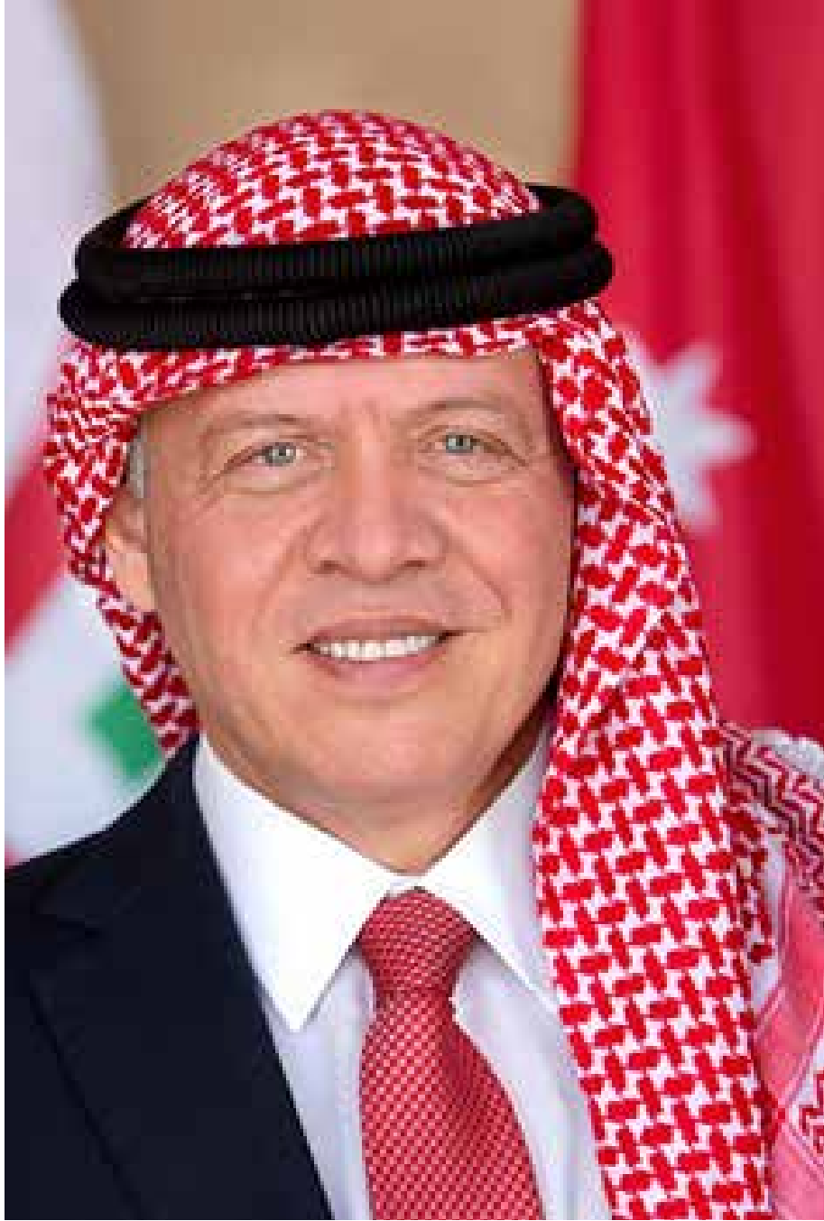
حضرة صاحب الجلالة الملك عبد الله الثاني في ابن الحسين المعظم