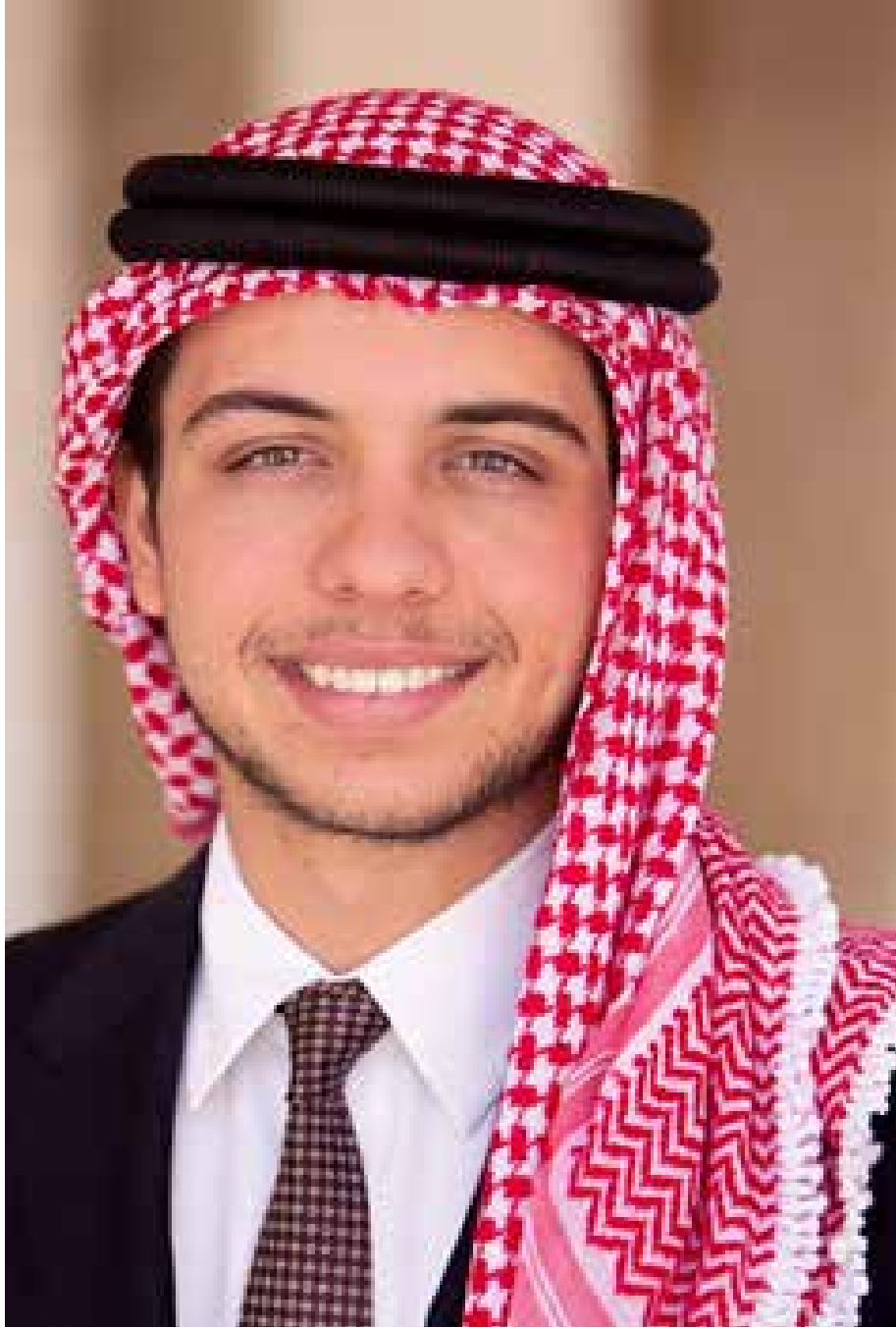
ولي العهد صاحب السمو الملكي الأمير الحسين بن عبد الله الثاني المعظم