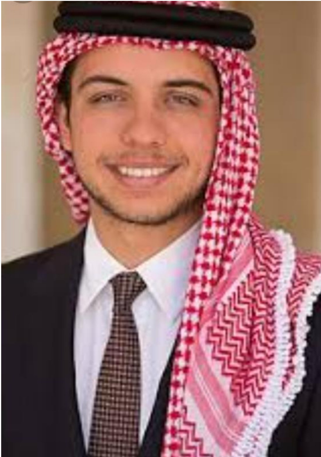
حضرة صاحب السمو الملكي ولي العهد الأمير الحسين بن عبدالله الثاني المعظم