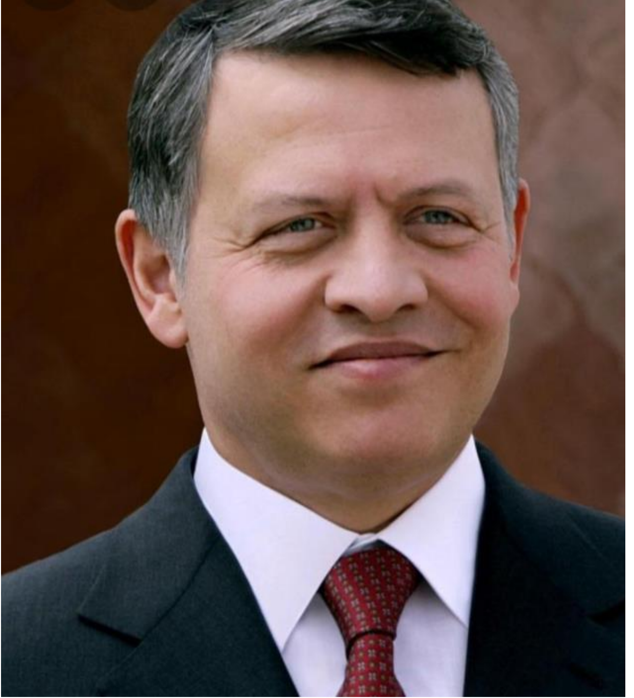
حضرة صاحب الجلالة الهاشمية الملك عبدالله الثاني بن الحسين المعظم