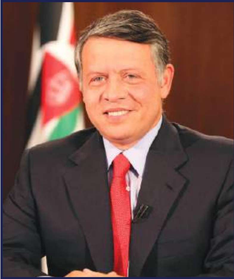
جلالة الملك عبد الله الثاني بن الحسين المعظم