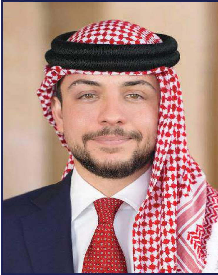
ولي العهد الامير الحسين بن عبد الله الثاني المعظم