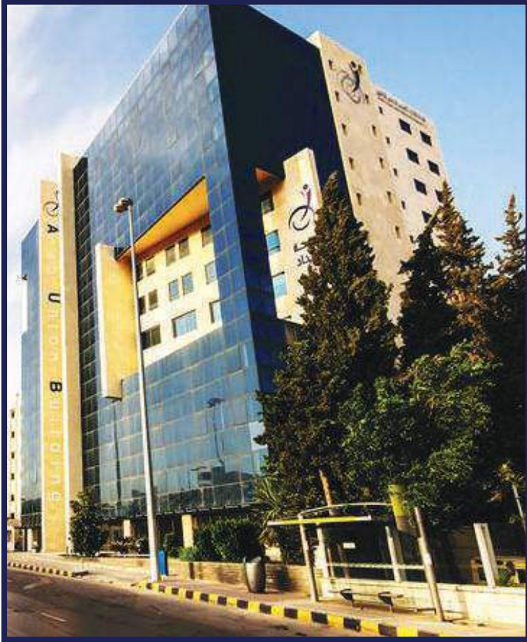
مبنى شركة الاتحاد العربي الدولي للتأمين