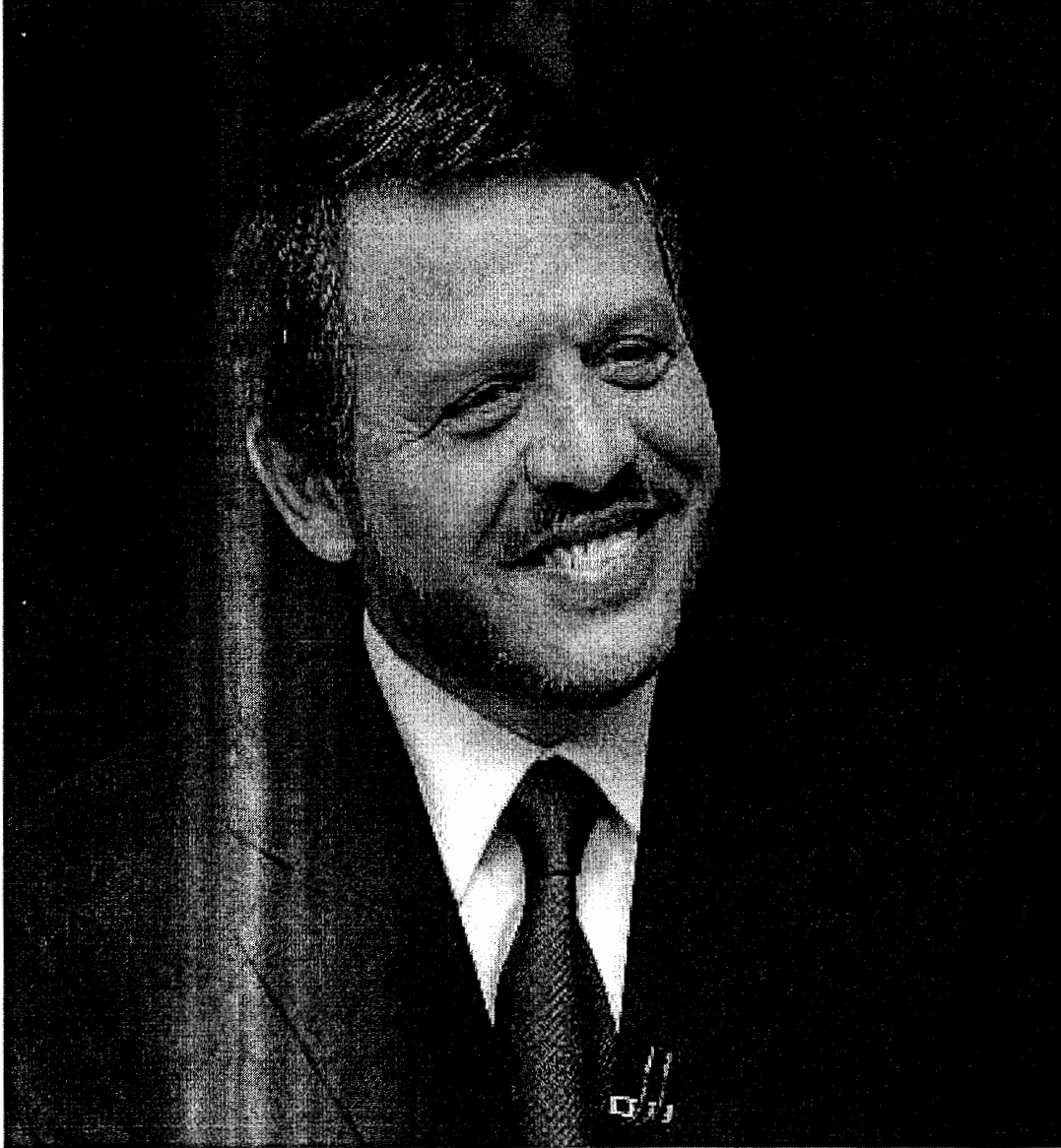
حضرة صاحب الجلالة الهاشمية الملك عبد الله الثاني ابن الحسين المعظم حفظه الله ورعاه