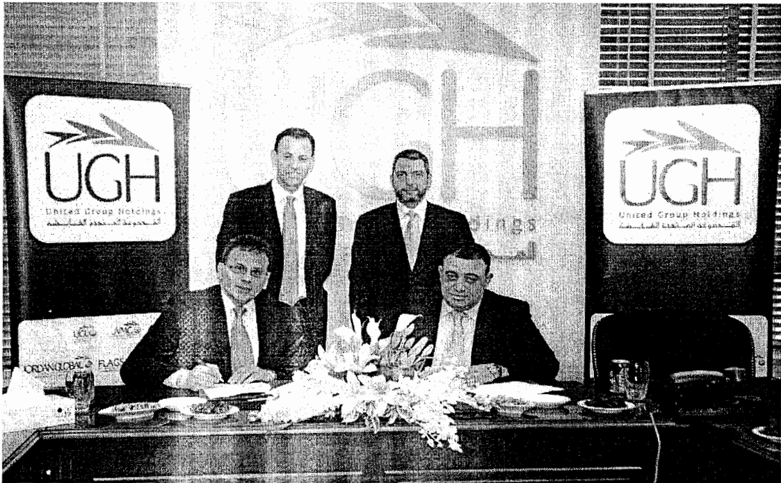
المجموعة المتحدة القابضة توقع على اتفاقية للتعاون المشترك مع شركة (MCG) الاسترالية