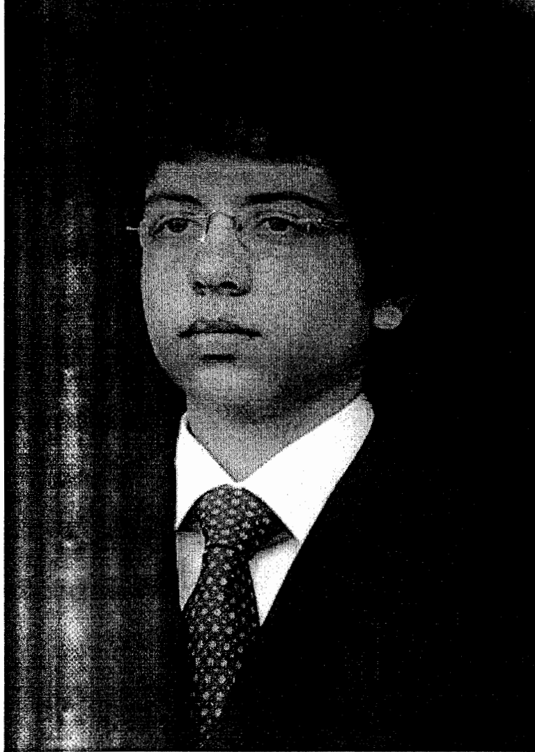
حضرة صاحب السمو الملكي الأمير حسين بن عبد الله ولي العهد حفظه الله ورعاه