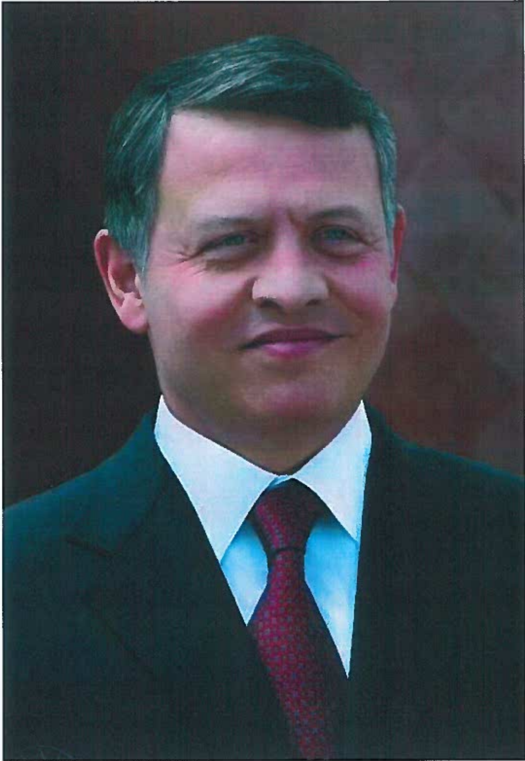
حضرة صاحب الجلالة الملك عبد الله الثاني بن الحسين