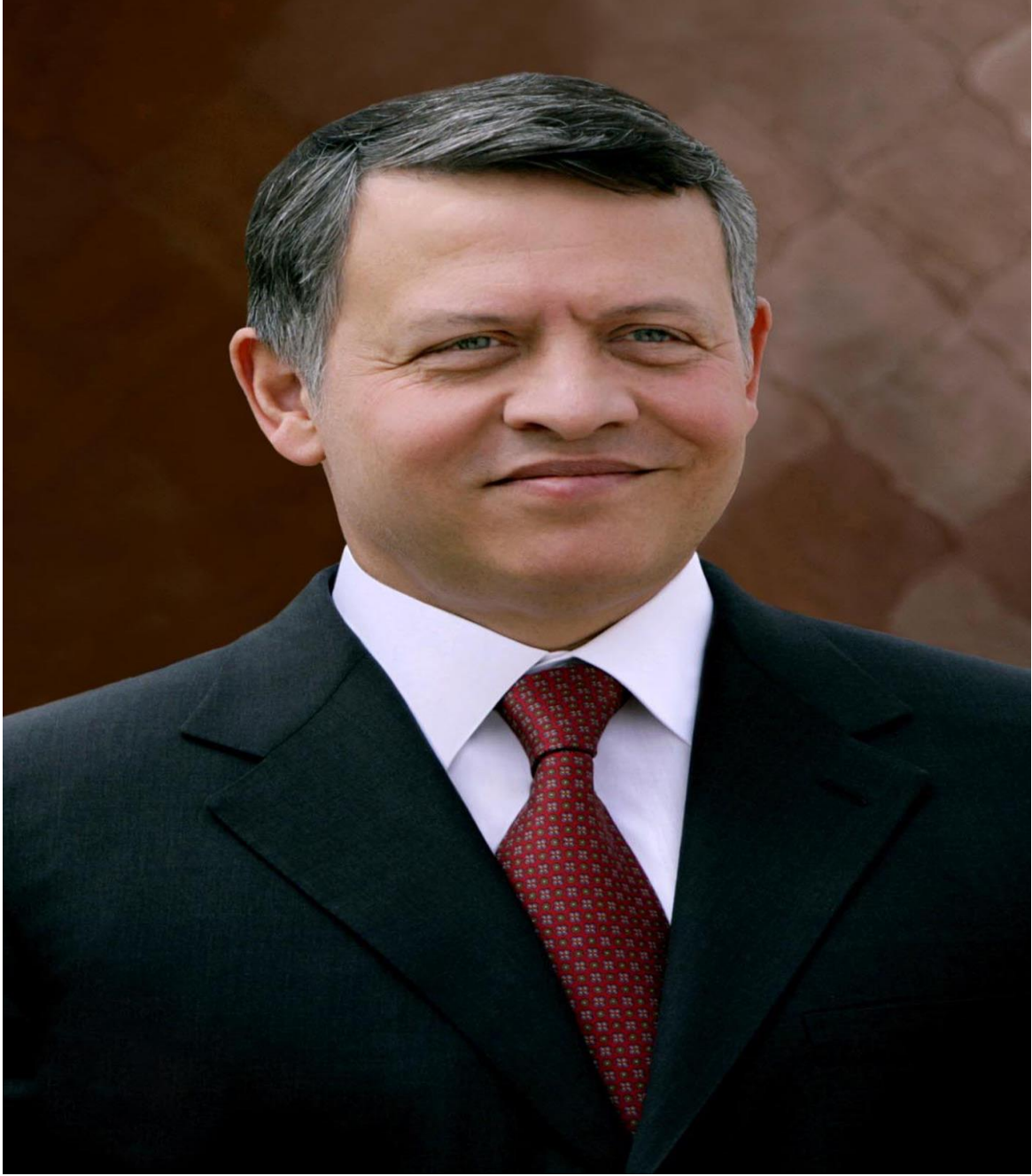
حضرة صاحب الجلالة الملك عبدالله الثاني بن الحسين المعظم