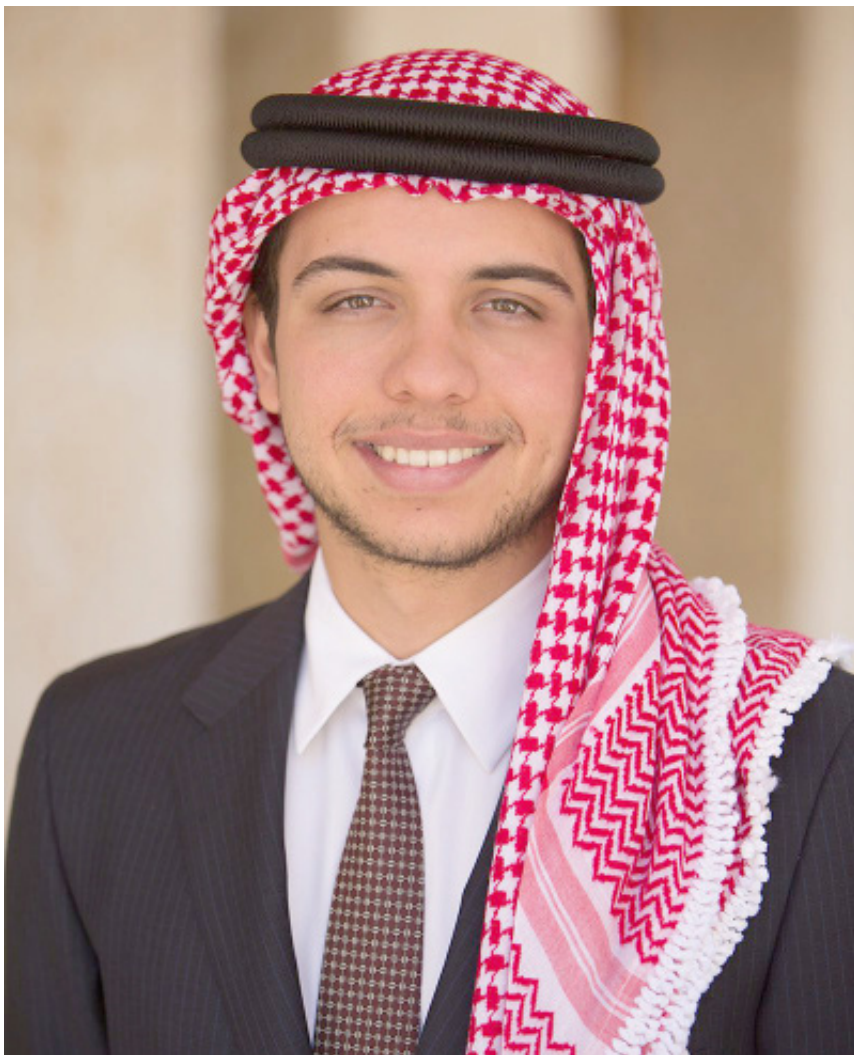
حضرة ولي العهد الحسين بن عبدالله الثاني حفظه الله و رعاه