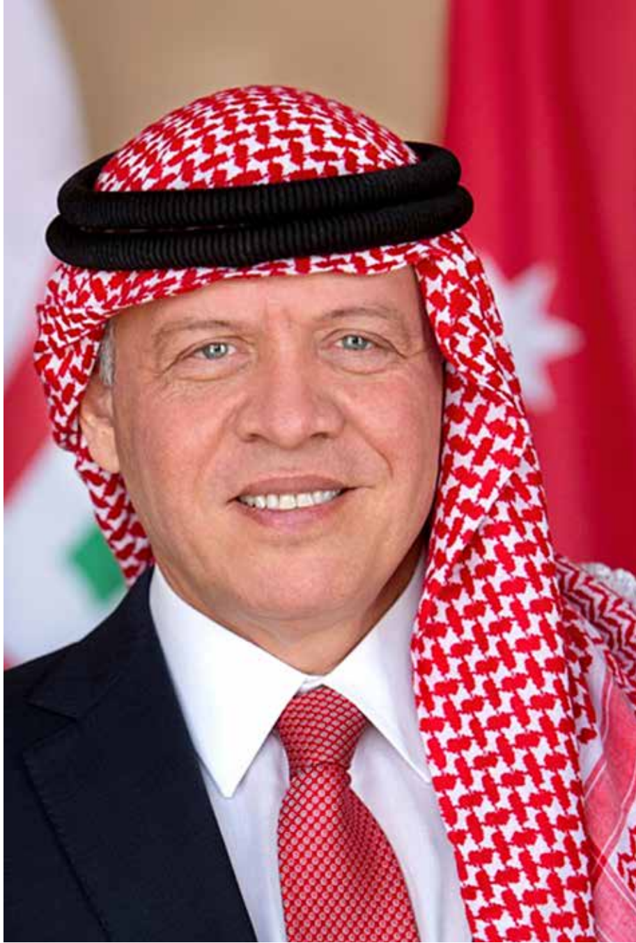
حضرة صاحب الجلالة الملك عبد الله الثاني في ابن الحسين المعظم