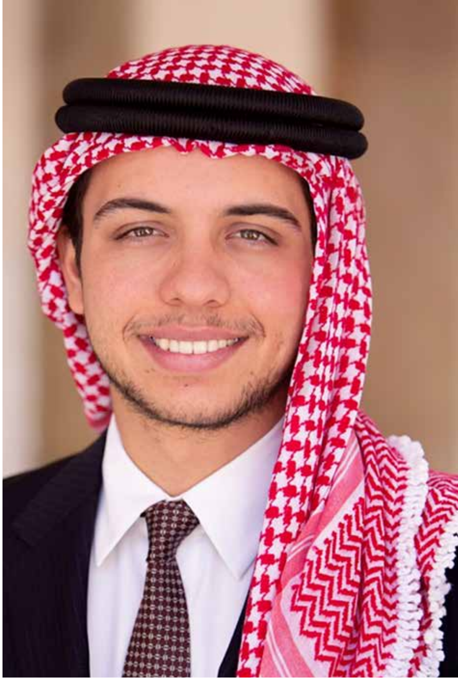
ولي العهد صاحب السمو الملكي الأمير الحسين بن عبد الله الثاني المعظم