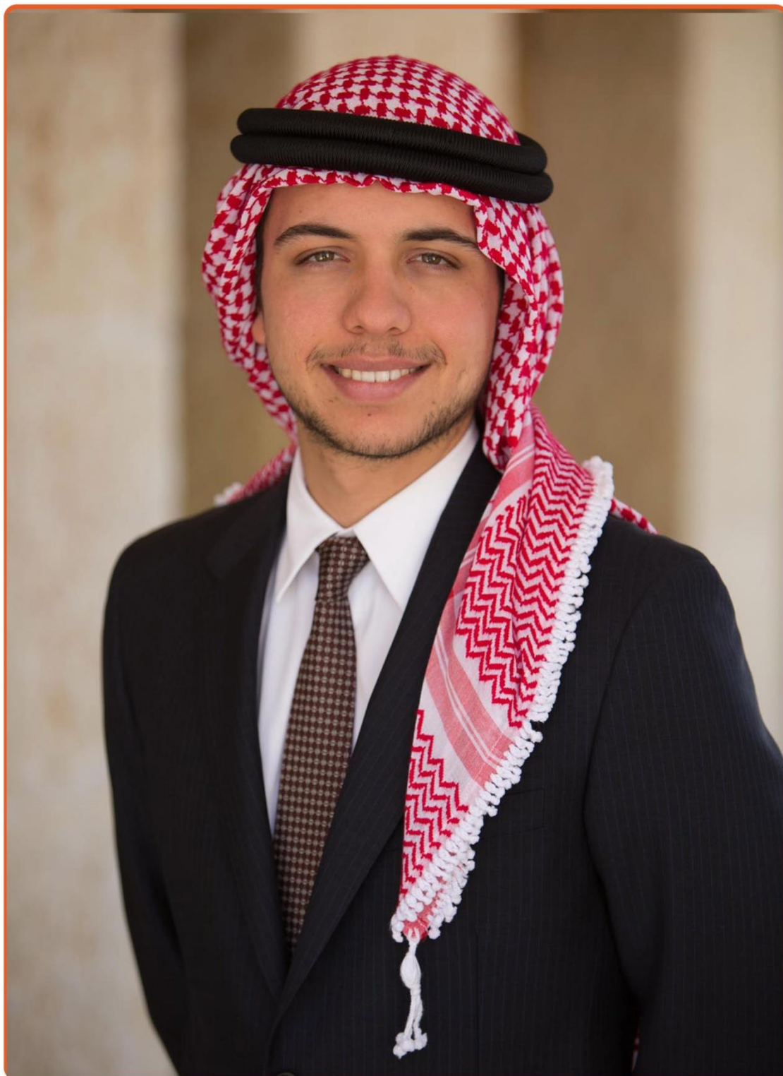
ولي العهد صاحب السمو الملكي الامير الحسين بن عبد الله الثاني بن الحسين المعظم