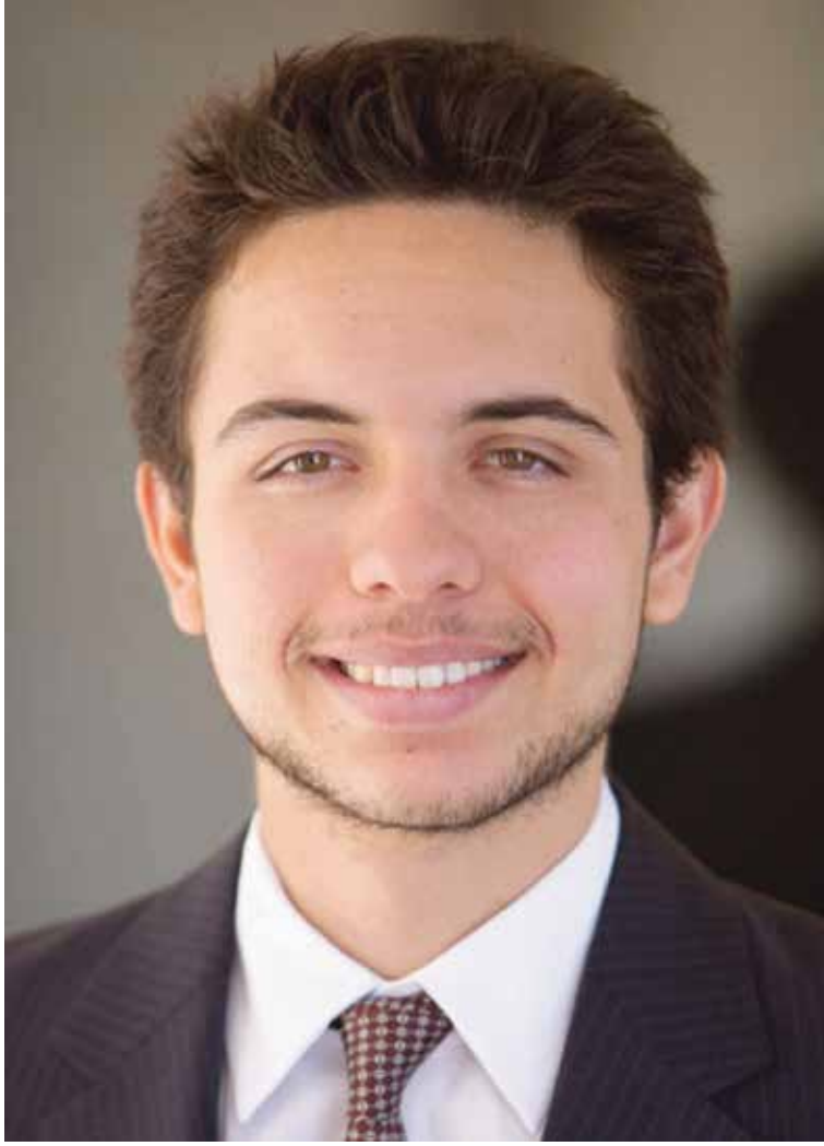
حضرة صاحب السمو الملكي الأمير حسين بن عبد الله الثاني ولي العهد