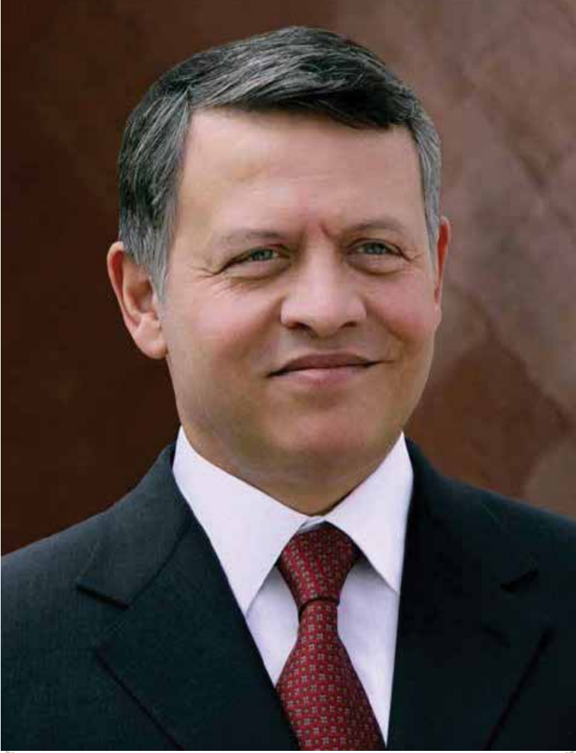
حضرة صاحب الجلالة الملك عبد الله الثاني ابن الحسين