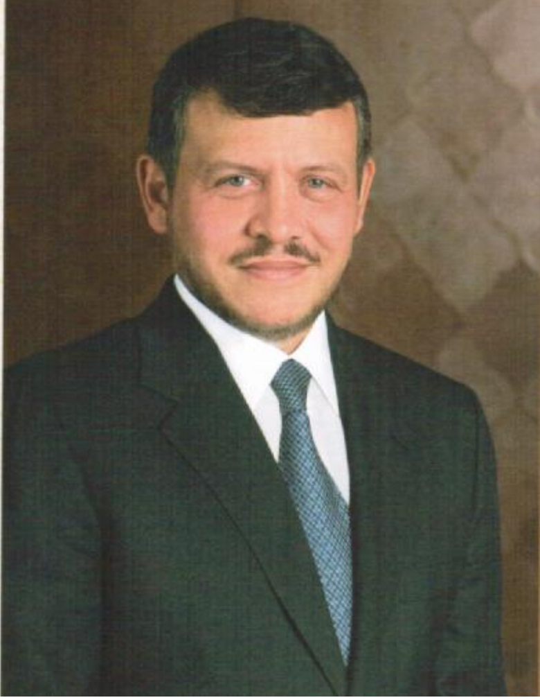
حضرة صاحب الجلالة الملك عبد الله الثاني بن الحسين المعظم