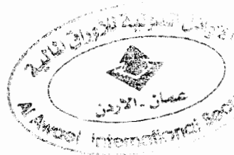
دانا العففي ضابط الامتثال