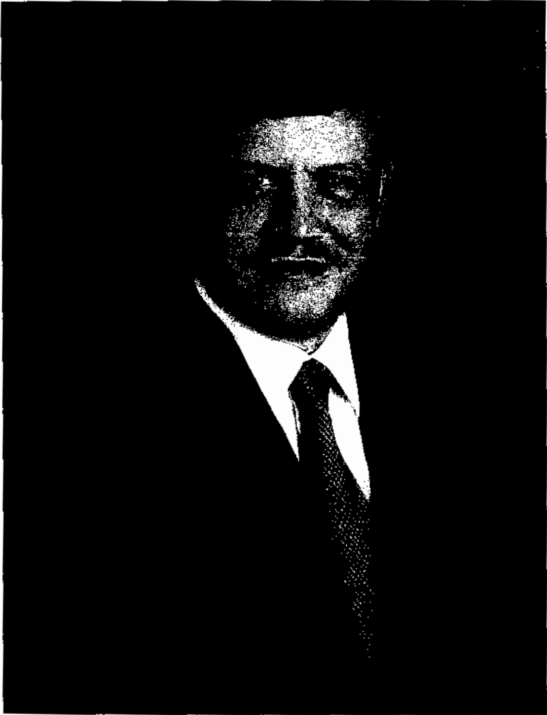
جلالة الملك عبد الله الثاني ابن الحسين المعظم