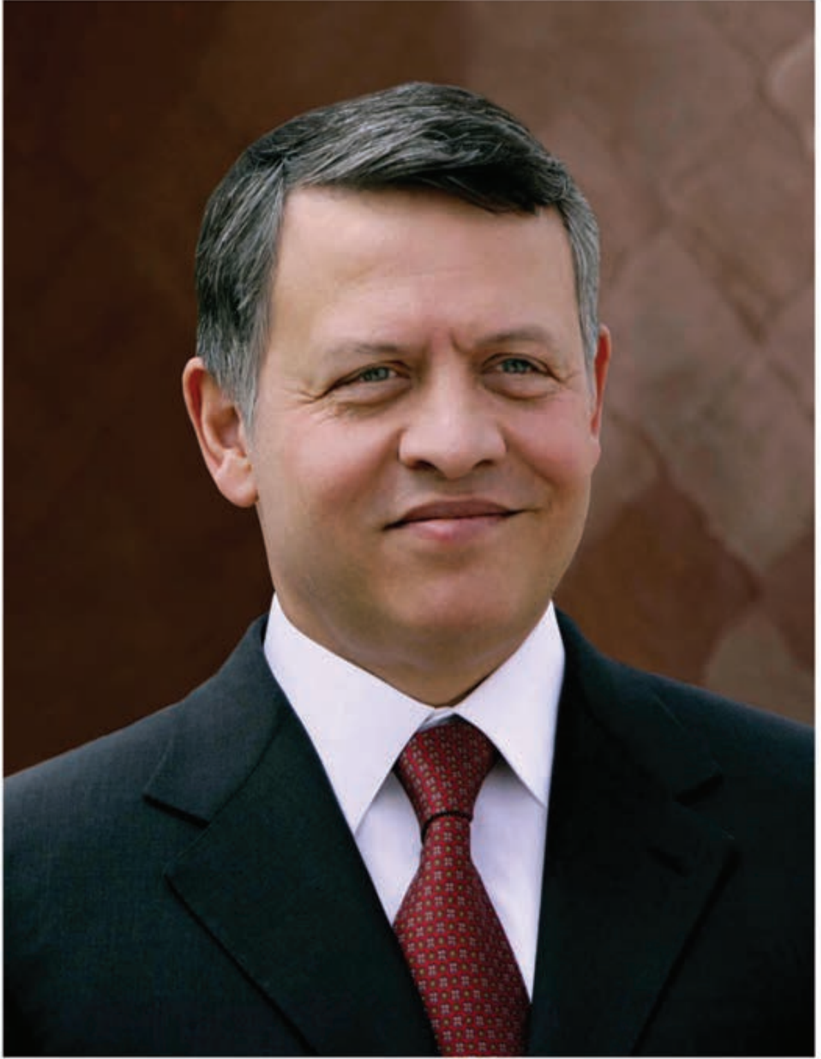
حضرة صاحب الجلالة الهاشمية الملك عبدالله الثاني بن الحسين المعظم