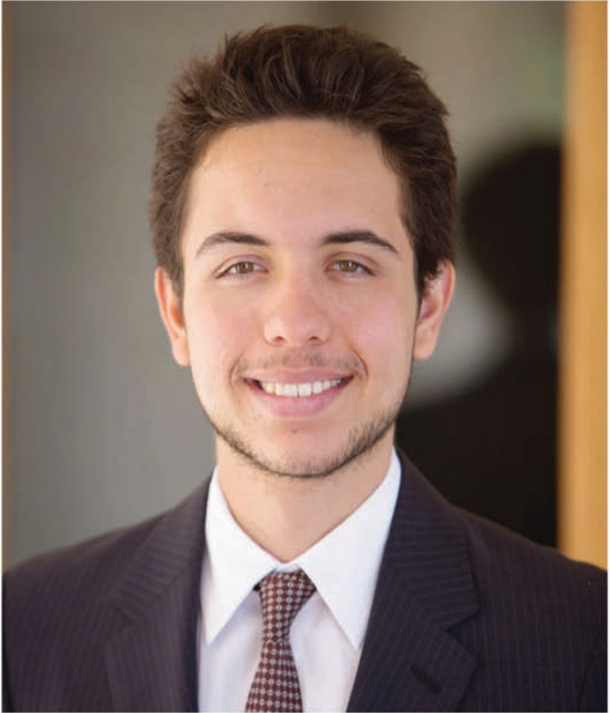
حضرة صاحب السمو الملكي الأمير الحسين بن عبدالله الثاني ولي العهد المعظم