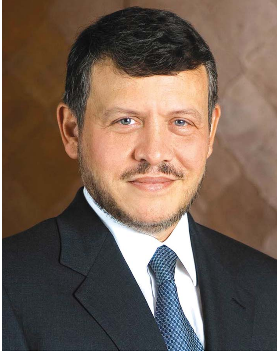
جلالة الملك عبد الله الثاني بن الحسين المعظم